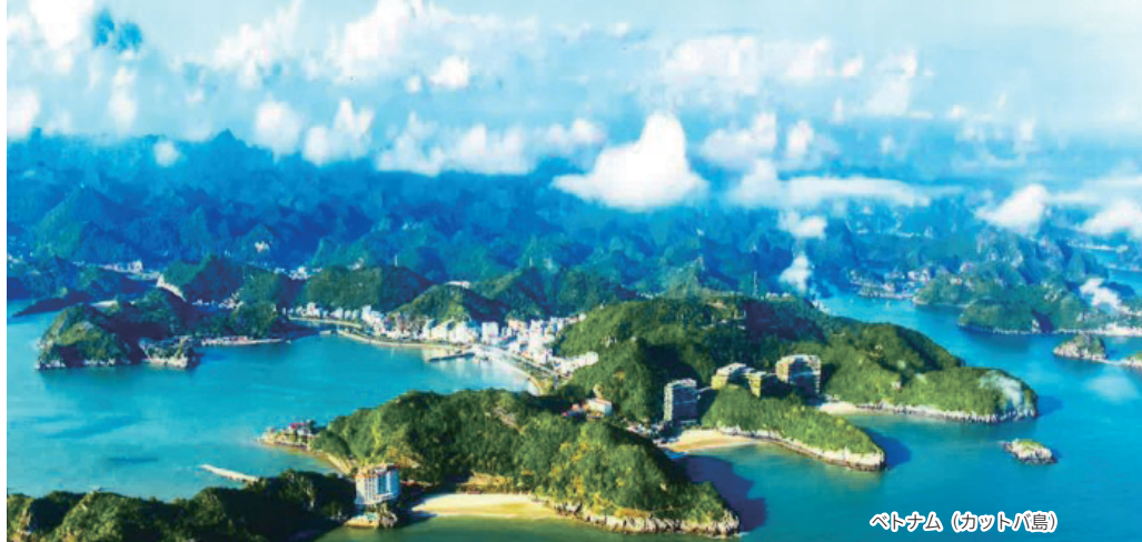
ベトナム (カットバ島)

本社:〒523-8555 滋賀県近江八幡市北之庄町908 TEL(0748)32-5111(代) FAX(0748)32-3339 / 東京支店 / 横浜支店 / 大阪支店